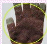
手のひら側に滑り止め処理