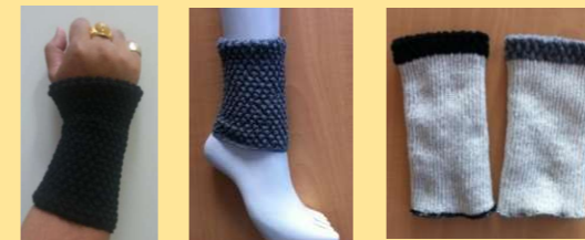
ブラック グレー シルク裏地