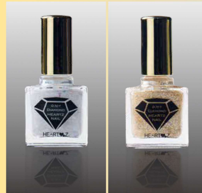
0.1ct ハーツネイル銀 (SILVER) 10 ml

私共は独自の「周波数加工®」…「ハーツ加工®」により、様々な「ハーツ製品」を生み出してまいりました。創業時より一般の方、医療関係者、スポーツを楽しむ方、学校やスポーツクラブで活動される方、プロスポーツ選手の方等々に御愛用頂き現在に至ります。